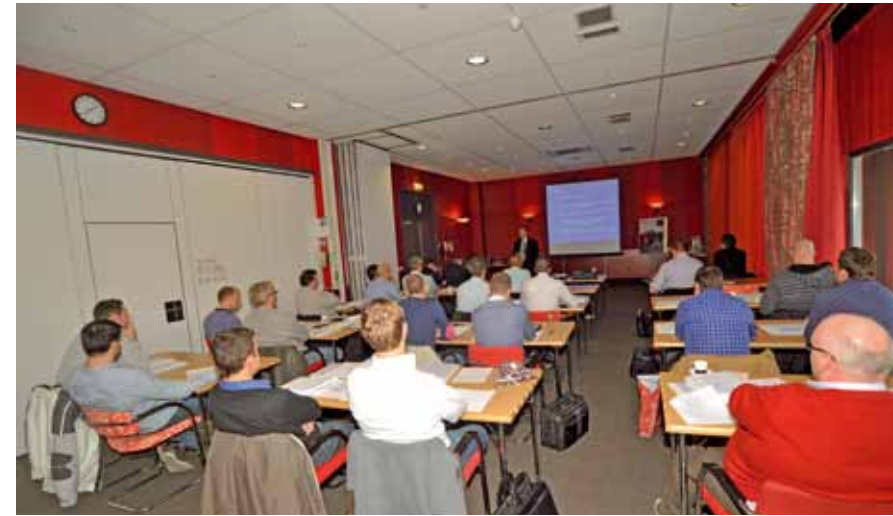
De 75ste groep aan het werk.

inzichten brengt met betrekking tot de te volgen methodiek voor de interne security audit en de uitwerking van risicoscenario's."